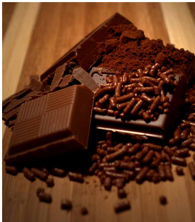
Man sieht es der Schokolade nicht an, aber der Kakao dafür wird häufig mit hochgefährlichen Pestiziden besprüht.

Vor dem Hintergrund der strukturellen Armut, in der die meisten Kakaobäuer*innen leben, sind sie besonders anfällig für die schädlichen Auswirkungen hochgefährlicher Pestizide. Ihre Einkommen sind häufig so gering, dass sie sich die notwendige Schutzausrüstung wie Handschuhe, Brillen oder Stiefel nicht leisten können. Die im Kakaoanbau eingesetzten Wirkstoffe können sowohl akute Vergiftungen als auch chronische gesundheitliche Folgen verursachen. Ohne ausreichende Schutzausrüstung sind die Kakaobäuer*innen diesen Risiken direkt ausgesetzt. Diese Wirkstoffe sind darüber hinaus auch für Menschen, die in der Umgebung von Kakao-plantagen leben, gefährlich.